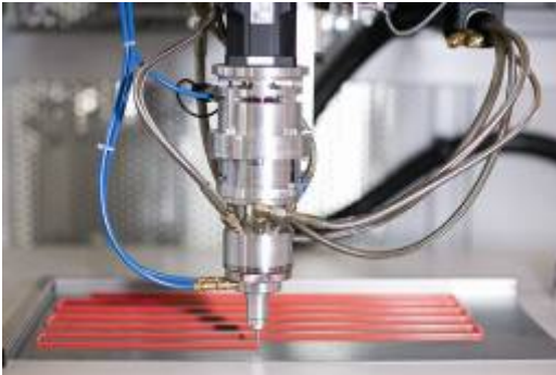
Pièce maîtresse de l'installation de dosage et de mélange: la tête de mélange MS-C

représente un gain de temps supplémentaire non négligeable. La documentation fournie est très détaillée, c'est un atout indispensable pour la gestion de la qualité.