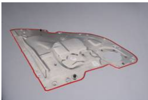
Module de portière étanché

L'installation se trouve sur le site de Wirthwein AG qui se charge, pour le compte de Brose Fahrzeugteile GmbH, du moulage par injection des pièces en matière plastique et de l'application du joint in-situ. Une fois étanchés, les modules sont alors livrés en « juste-à-temps » chez Brose.