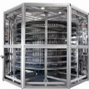
Carrousel sur mesure

Une autre composante joue un rôle important pour l'amélioration de l'efficacité : l'automatisation très élaborée. Un système de convoyage spécifique transfère les pièces vers le robot d'application du joint puis les achemine vers un carrousel de séchage. Ces carrousels, avec chargement et déchargement automatique, sont une spécialité de RAMPF Automation. Au cours des six dernières années, divers types de carrousel à convoyeur hélicoïdal ont été développés, à fonctionnement continu (les pièces sont simplement convoyées d'un bout à l'autre) ou cadencé (selon le principe FIFO). Ces installations développées par RAMPF Automation peuvent traiter quatre modèles de pièces différents, que l'utilisateur choisit tout simplement en appuyant sur un bouton. Wirthwein dispose ainsi de toute la flexibilité nécessaire pour produire soit une série d'un même modèle ou à contrario des jeux de 4 modèles différents.